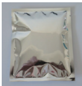
商品 アルミ蒸着袋入り