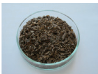
微生物製剤「バイオコート」 15g入り